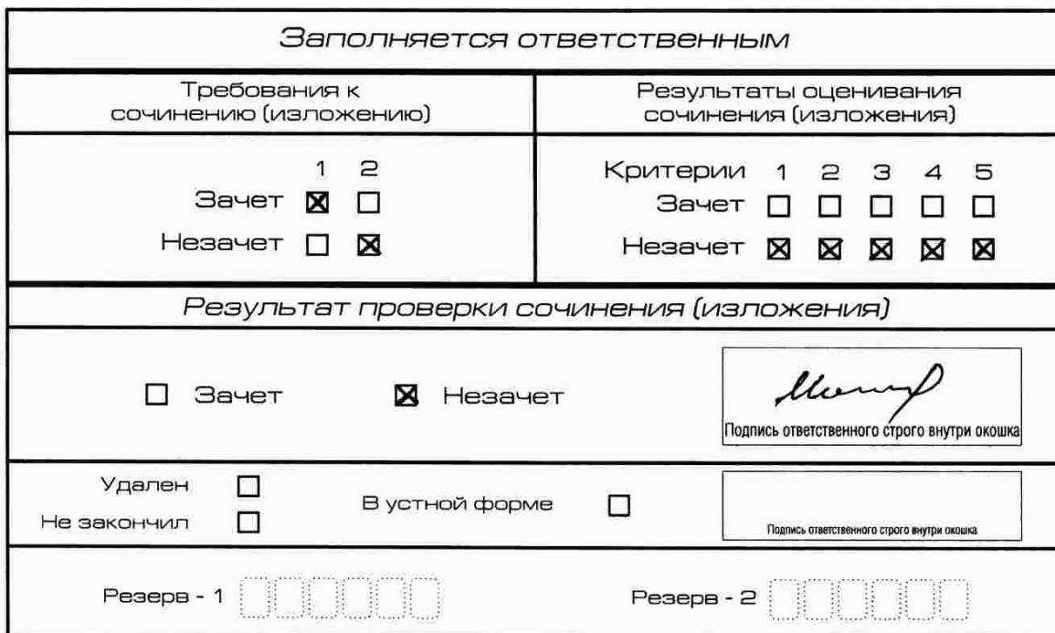
Рис. 9. Область для оценки работы

Если итоговое сочинение (изложение) соответствует требованию № 1 и требованию № 2, то выставляется «зачет» за выполнение требования № 1 и требования № 2. Указанные сочинения (изложения) далее оцениваются по критериям.