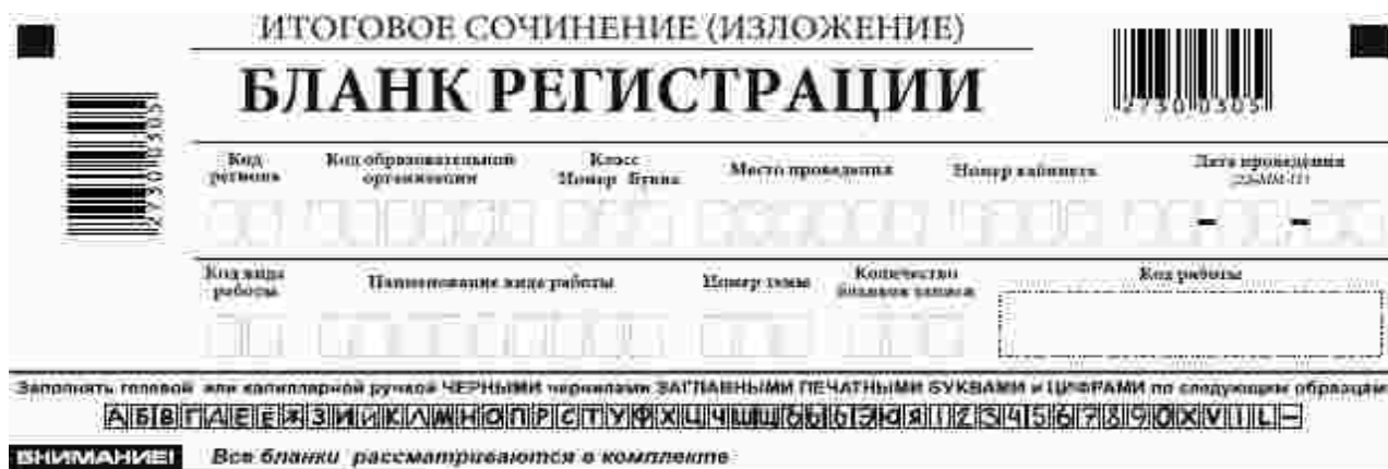
Рис. 2. Верхняя часть бланка регистрации

Бланк регистрации (рис. 1) состоит из трех частей: верхней, средней и нижней.