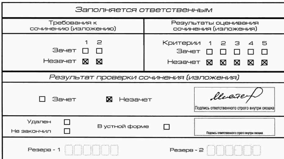
Рис. 8. Область для оценки работы