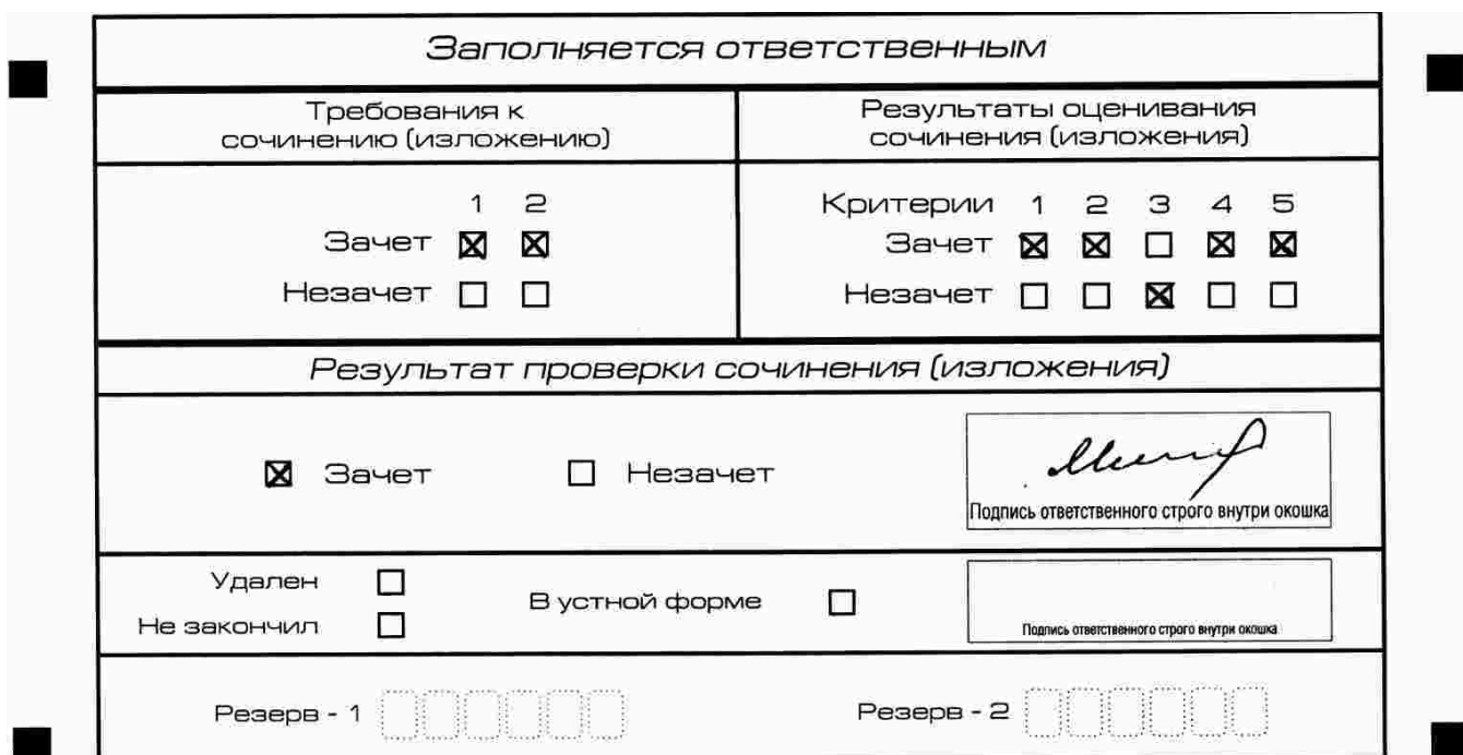
Рис. 10. Область для оценки работы

3. Во всех остальных случаях итоговое сочинение (изложение) проверяется по всем пяти критериям и оценивается по системе «зачет»/«незачет».